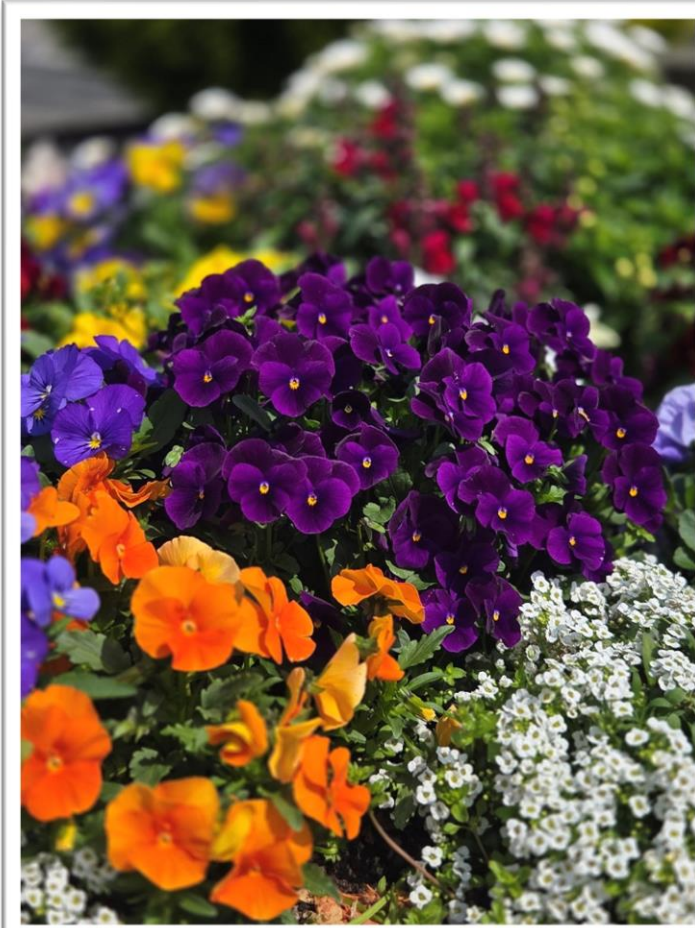
病院駐車場の花壇。 パンジーとアリッサム。 (令和8年3月28日撮影)