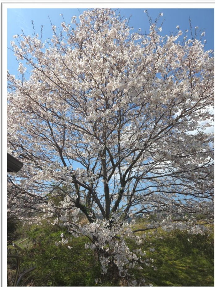
病院敷地内。桜。 (令和8年4月3日撮影)